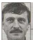
par Pierre Noverraz

Une maison en bois massif assemblée, une scie mobile pour le long bois et une luge souple: les trois innovations du Jurassien Pierre Messerli font la part belle au bois indigène