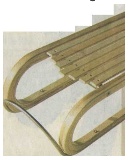
Une luge à suspension que l'on dirige avec le poids du corps.